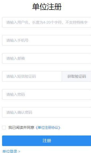
图 1 单位注册

注册成功后，用户输入已注册的手机号、用户名或邮箱（三种信息择一填入）、密码、验证码可直接登录系统。